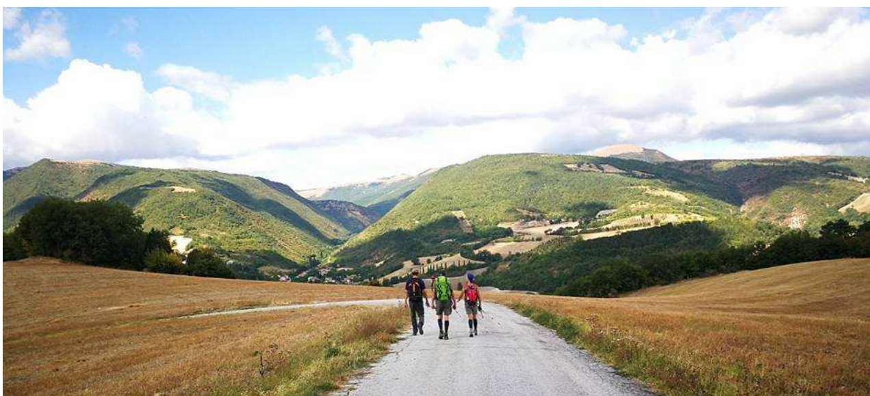
Il sentiero verso Nocera Umbra (sopra) e (sotto) la Torre civica