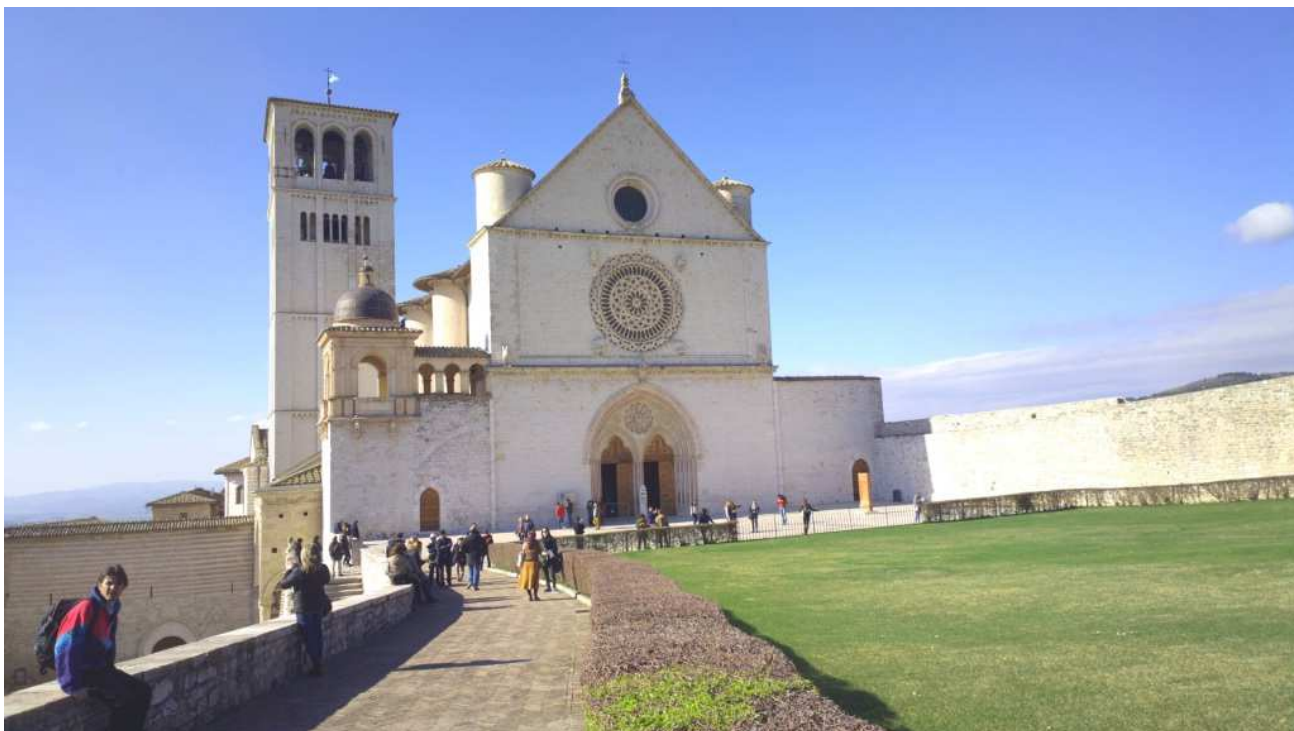
Assisi: la Basilica di San Francesco e (sotto) una veduta del centro storico

Mattinata libera per ulteriori visite ai siti salienti di Assisi. Trasferimento alla stazione di Santa Maria degli Angeli e partenza dei partecipanti per le proprie sedi di provenienza.