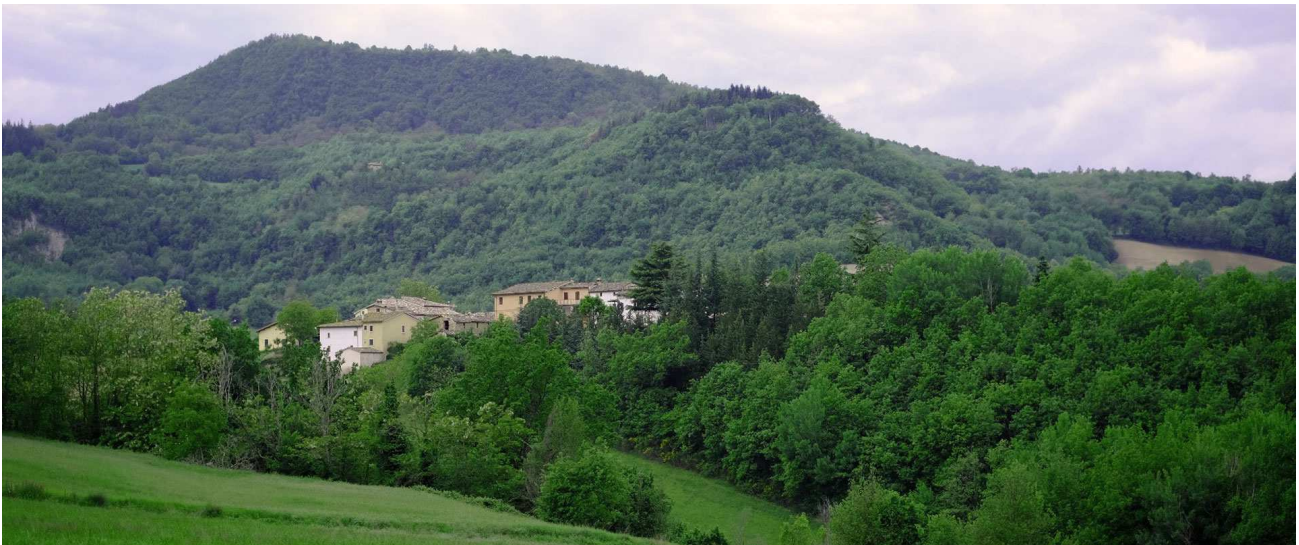
Il borgo di San Maroto