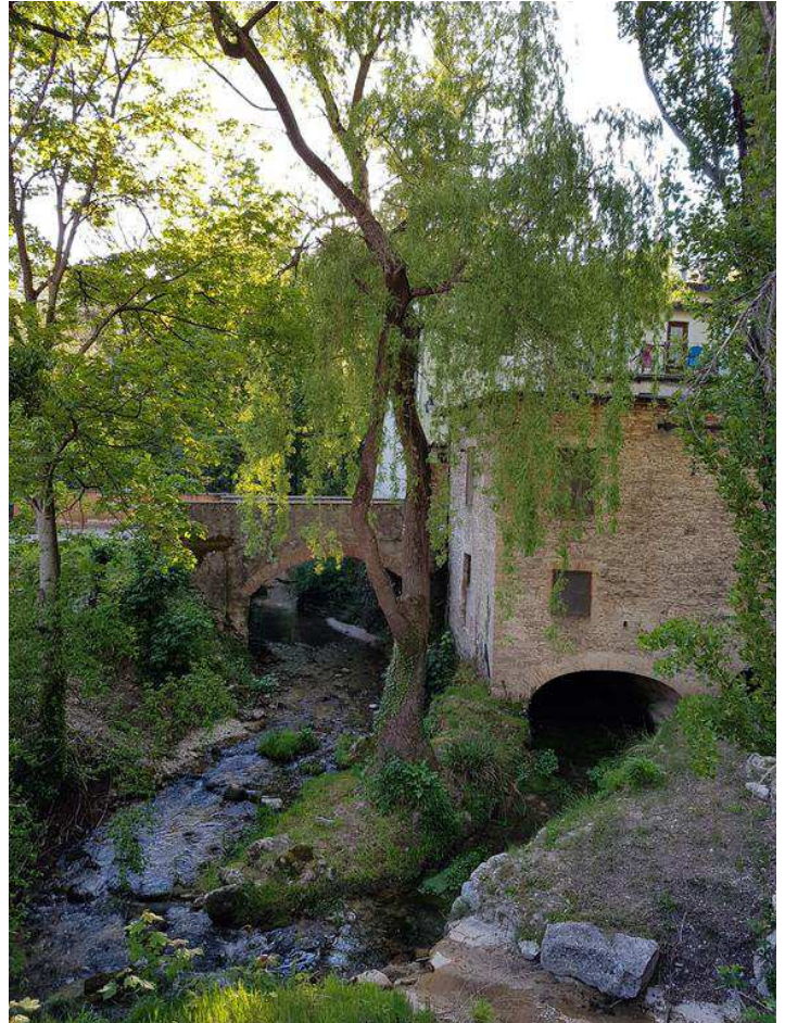
Il vecchio Mulino e centrale idroelettrica di Gelagna Bassa

Quota di partenza: 471 m - Quota di arrivo: 760 m Dislivello salita: 850 m - Dislivello discesa: 480 m Ore di cammino nell'arco dell'intera giornata escluse le soste: 6,00 Lunghezza 26 km