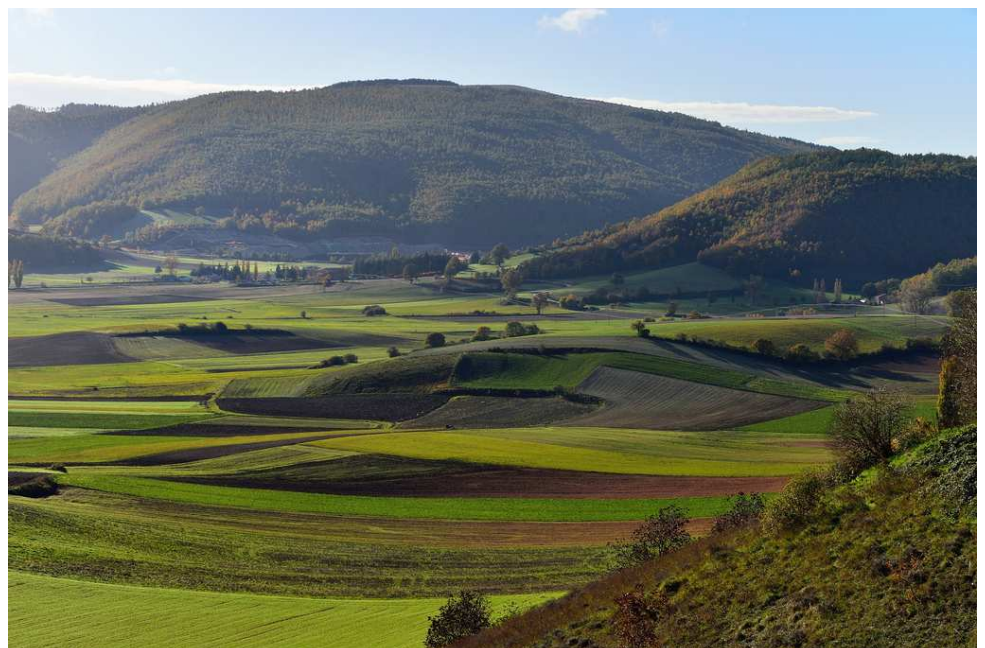
Piana di Colfiorito