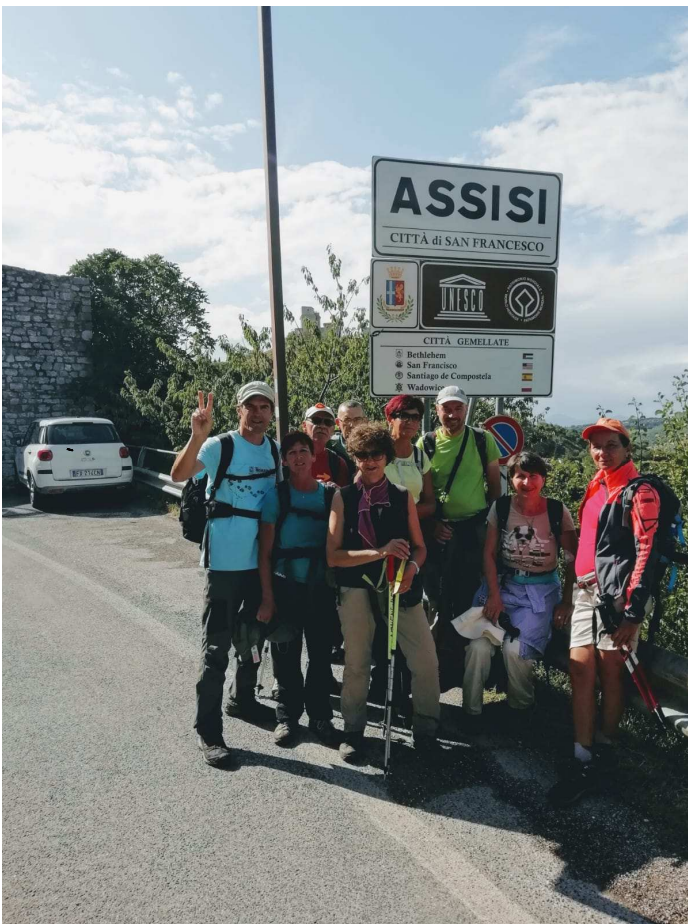
L'arrivo ad Assisi da Porta Perlici