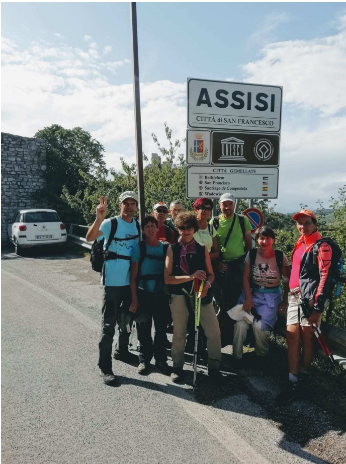
L'arrivo ad Assisi da Porta Perlici